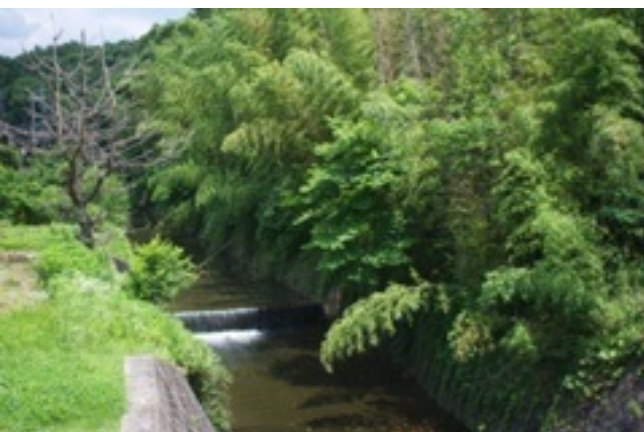
(近くに通る川も涼しげ)

こんなさわやかな場所で、どちらかといえばジックリジワジワ耐えに耐え忍ぶ感じの深浦先生が羽生先生と対局を...と思って車から降りたら、とたんに汗がどばっと噴き出して、全然間違ってますんで