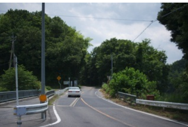
(どんどん山の中へ)

愛知県民のわりに豊田市に行ったことが無く、勝手に工業都市のイメージがありました。しかし、実際は車でしか行けないような緑が深い場所にあります。