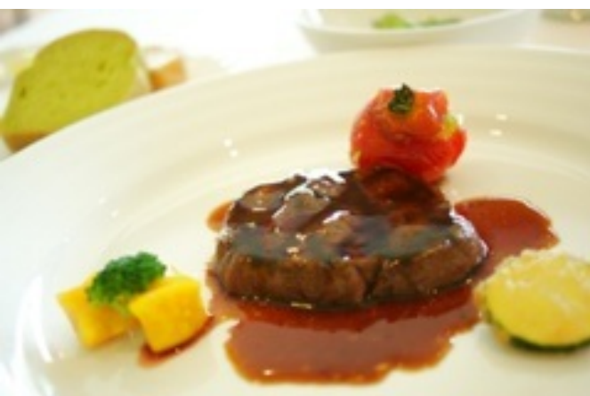
(フィレ肉とパン) (組み合わせは合ってる)

特注メニューだったか...と思って未練がましくフィレ肉のグリルがメインのランチを頂きました。ジューシーで美味しかった。